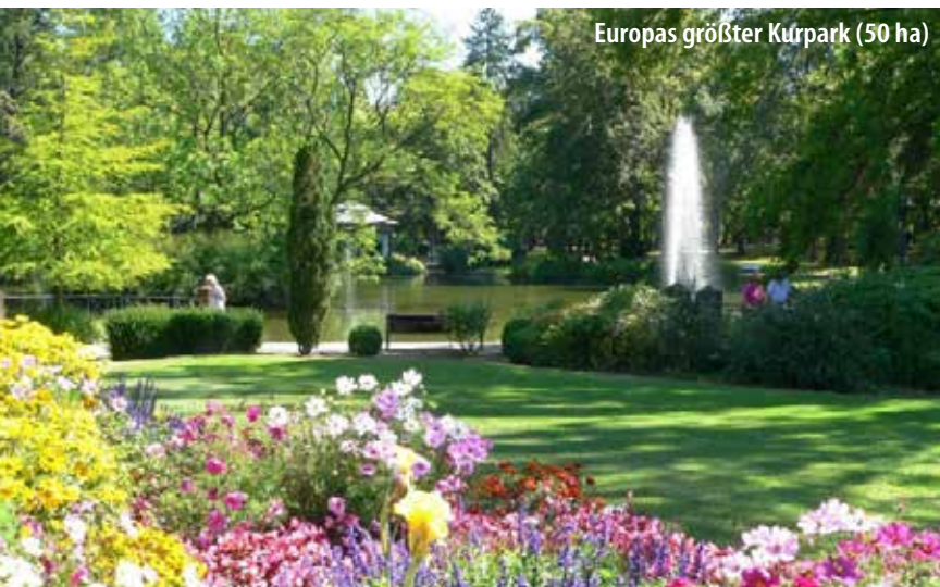
Europas größter Kurpark (50 ha)