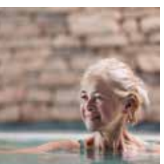
RELAX – Seele baumeln lassen