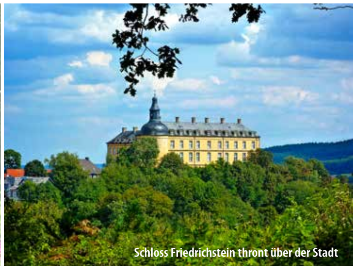
Schloss Friedrichstein thront über der Stadt