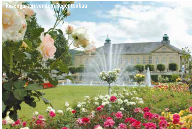
Rosengarten vor dem Regentenbau