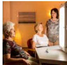
WINTERSONNE (1) (LICHTTHERAPIE)