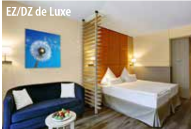
EZ/DZ de Luxe