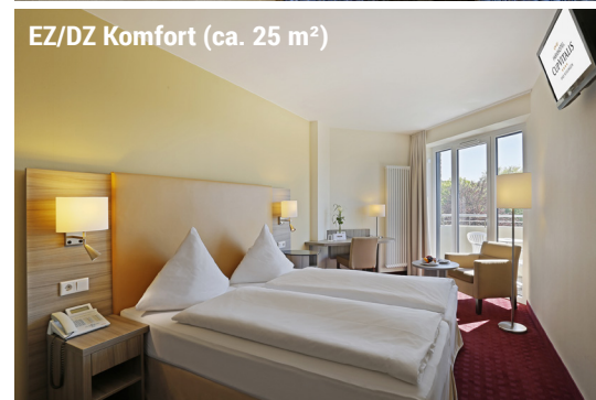
EZ/DZ Komfort (ca. 25 m 2 )