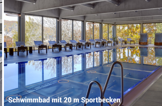
Schwimmbad mit 20 m Sportbecken