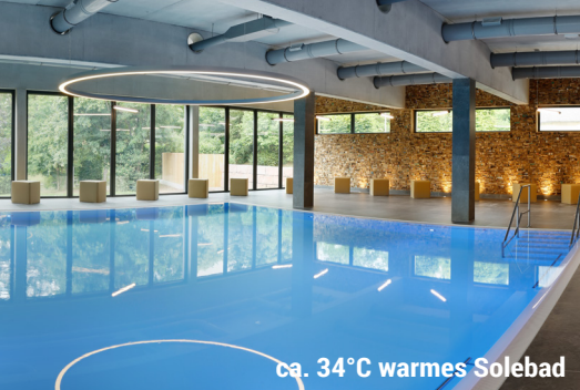
ca. 34°C warmes Solebad