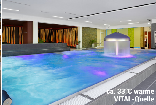
ca. 33°C warme VITAL-Quelle