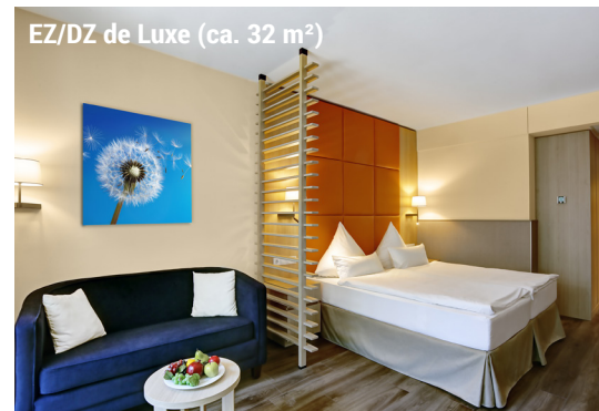
EZ/DZ de Luxe (ca. 32 m 2 )